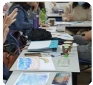
חווית הלמידה במגמה