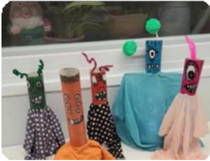
פאני סידאוי יוצרת בובות - מעיוותי חשיבה