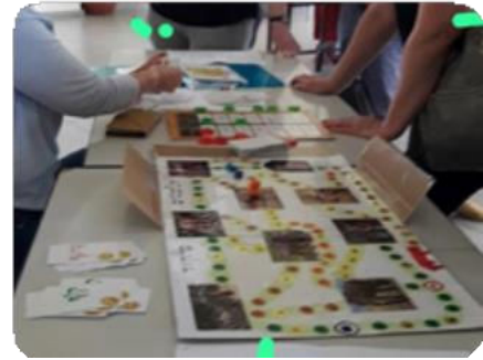
משחק שפיתחה מיכל רימר